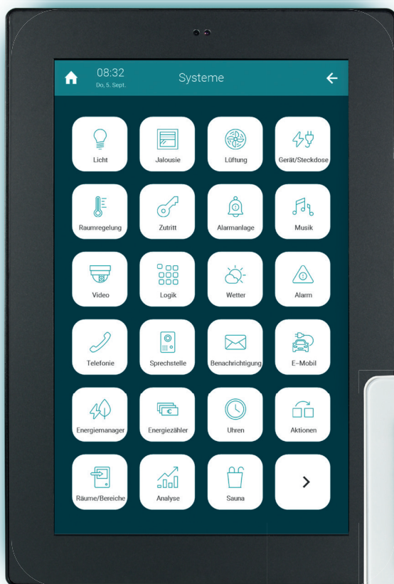
TEKKO Displaycontroller 10 Zoll

Setzen Sie Projekte schneller und einfacher um, durch die intuitive Einbindung und Vernetzung verschiedener Geräte und System in einer All-In-one-Lösung ganz ohne aufwendige Programmierung.